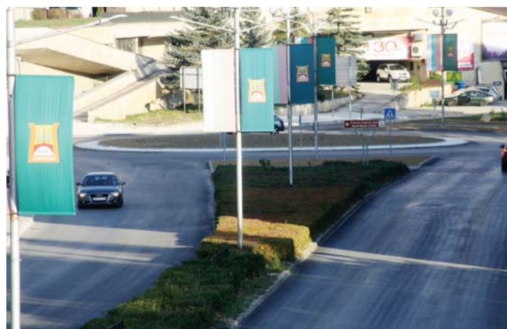
По бул. „България“ са предвидени 4 нови кръстовища.

200-300 хил. лв. в зависимост от проекта, спецификата на самото кръстовище и