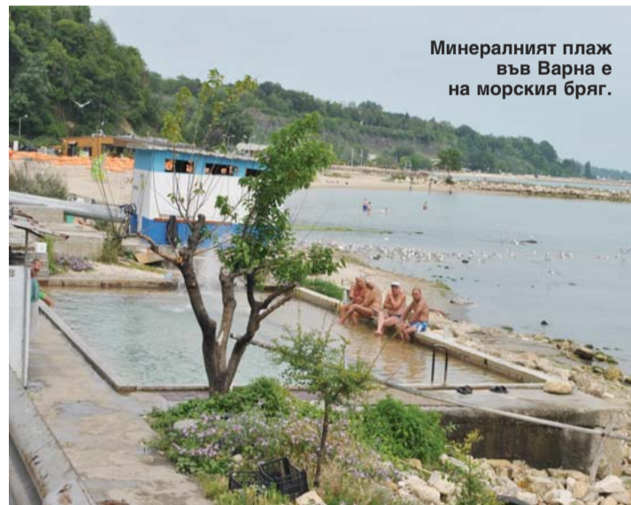
Минералният плаж във Варна е на морския бряг.

С течение на времето обществените чешми бяха затворени и сега хората пълнят минерална вода само от тази до ба-