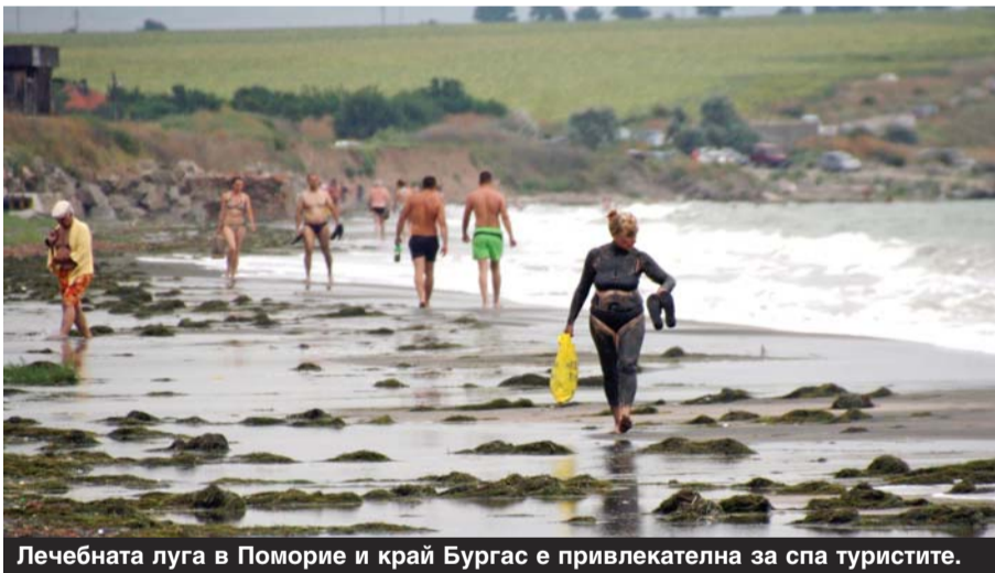
Лечебната луга в Поморие и край Бургас е привлекателна за спа туристите.