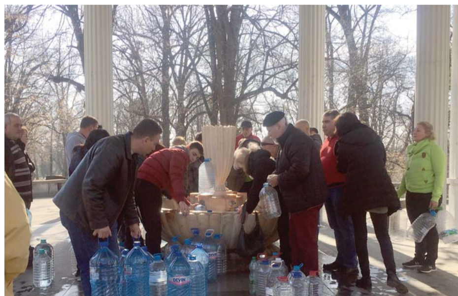
Всеки ден десетки жители на Хисаря и от други места идват, за да си наляят от лековитата вода.

Осем медицински бази, 4 почивни станции, 15 хотела и 16 бунгала и къщи