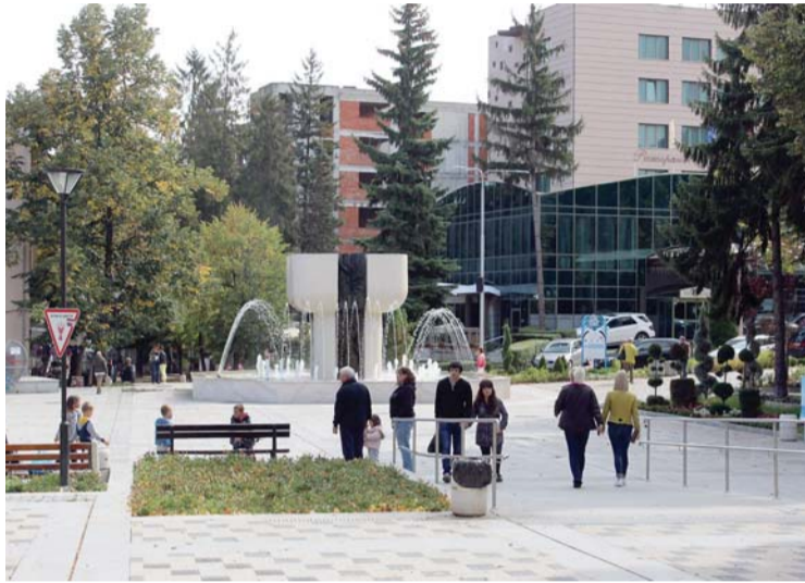
Центърът на Велинград е реновиран по европейски програми.

Подобна лечебна практика има и в Кремъчната баня. Там обаче водата се охлажда до 35-