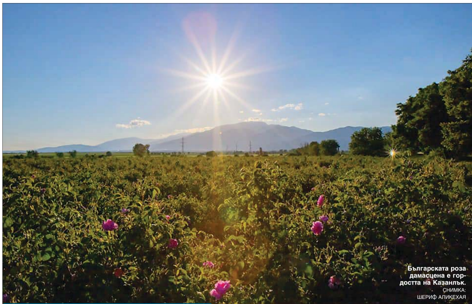
Българската роза дамасцена е гор- достта на Казанлък.